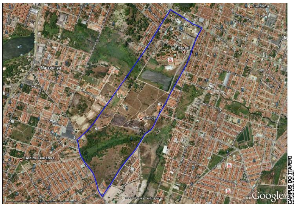
Figura 2 - Vista aérea do Campus do Itaperi, Fortaleza, Ceará.

A Universidade Estadual do Ceará localiza-se no Campus do Itaperi, mais precisamente na Av. Paranjana nº 1700 – Bairro Serrinha – Fortaleza - Ceará, abrangendo uma área total de 104 hectares (Figura 2).